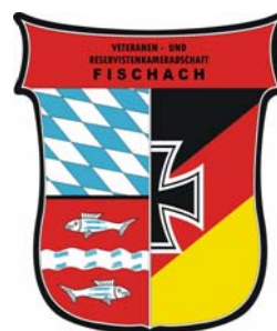
Wolfgang Mayr Vorsitzender RK Fischach

Der Unkostenbeitrag pro Person beträgt 13,- € incl. Sektempfang Um telefonische Anmeldung bzw. Tischreservierungen wird bis zum 20.04.2008 unter 08236/602 oder 08238/7507 gebeten. Anzug: Uniform o. festliche Abendbekleidung